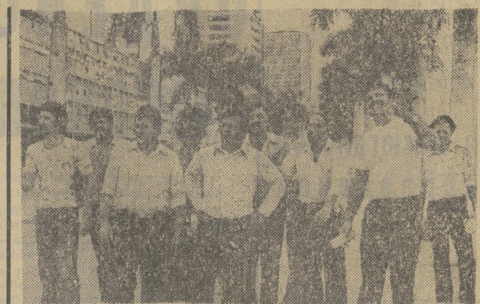
11 ноября — национальный праздник Народной Республики Анголы — День независимости. НА СНИМКЕ: советские моряки во время эскурсии по Луанде.

ЛОНДОН. Гневным возмущением встретила английская общественность появившиеся в печать сообщения о том, что летом 1958 года в восточной Англии находилась на грани превращения в радиолокационный пункт в результате катастрофы самолета на одной из военно-воздушных баз. Тогда американский бомбардировщик «В-47» рухнул на здание склада, в котором находились радиоэлектронные аппараты.