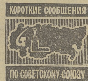
ПО СОВЕТСКОМУ СОЮЗУ

Бригада намерена оправдать название вахты и отметить олимпийский год высокими трудовыми достижениями.