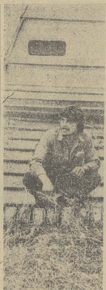
Совхоз имени 50-летия СССР Томского района одним из первых в области выполнил план заготовки сенажа. Эта работа продолжается.

Были рассмотрены вопросы вахтовой организации труда, дорожного строительства, создания произ-