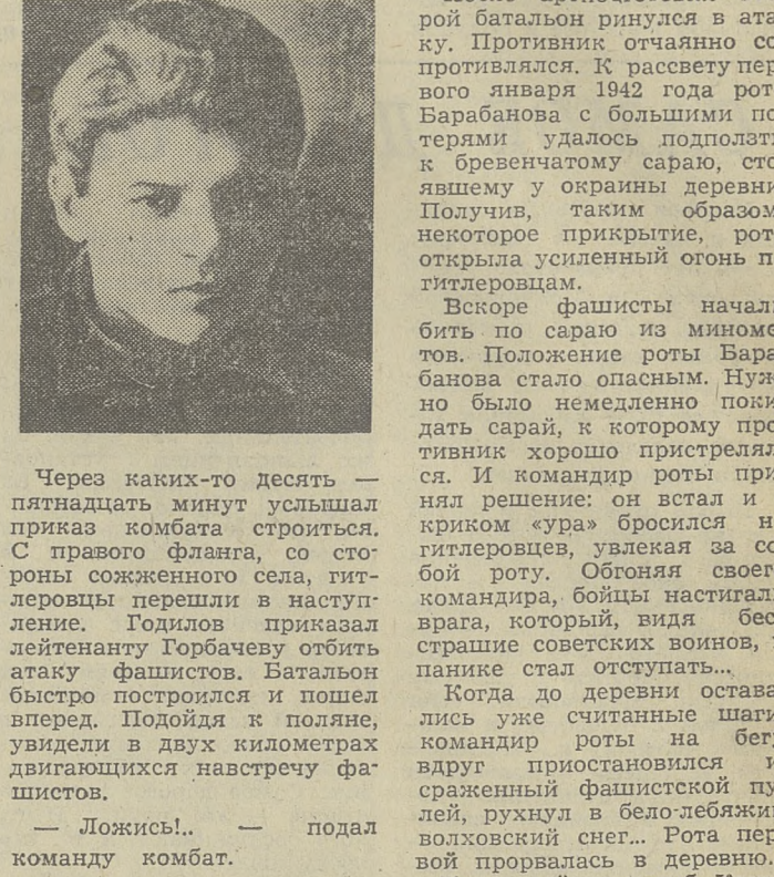
Через каких-то десять — пятнадцать минут услышал приказ «комбат» стрелкам.

«Что ж, постараясь...» Барabanов любил бойцов. Он был и их начальником, и самым близким другом, советчиком.