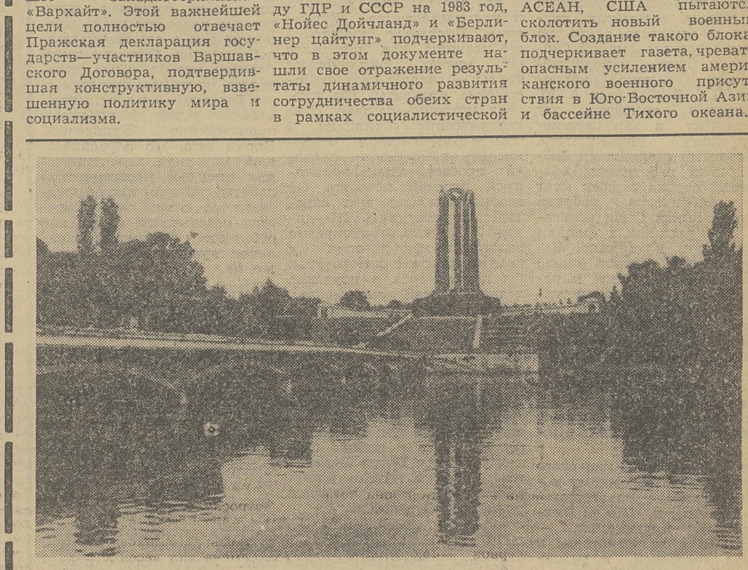
4 февраля исполняется 35 лет со дня подписания Договора о дружбе, сотрудничестве и взаимной помощи между Советским Союзом и Социалистической Республикой Румынией.

экономической интеграции. О плодотворности советско-чехословацкого экономического сотрудничества пишет пражская «Прага». При координации планов развития науки и техники на 1981-1985 гг., указывает, в частности, газета, обе страны определили более 320 проблем и тем, которые будут разработаны совместными усилиями. Повышение эффективности экономики, улучшение ее сбалансированности — ведущая тема внутриполитических разделов «Ненасад» и других венгерских газет.