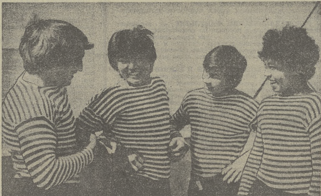
У этих ребят из Моряковского ПТУ-4 хорошее настроение. Сейчас у них перерыв в жизни производственной практики. И все идет хорошо. Со своими обязанностями моториста-рулевого на тепловозе «ОГ-31» они справляются успешно.

Вспоминать начало войны, а с сожалением думаю о том, что мало было в нас военной техники, не хватало орудий, боеприпасов. И в этом, конечно же, одна из основных причин трагедии 1941 года. Никто из нас не в праве забывать об этом. Вспоминать начало войны, а с сожалением думаю о том, что мало было в нас военной техники, не хватало орудий, боеприпасов. И в этом, конечно же, одна из основных причин трагедии 1941 года. Никто из нас не в праве забывать об этом.