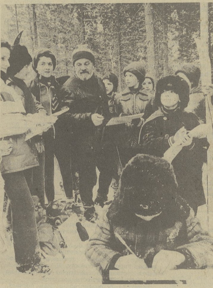
Увлеченно занимается ребята в детской художественной школе города Стрежевого. Работы, созданные юными художниками, выставляются на отчетных выставках в Домах культуры, в центрах общественно-политической работы вахтовых поселков нефтяников, несколько рисунков экспонировались в ГДР.