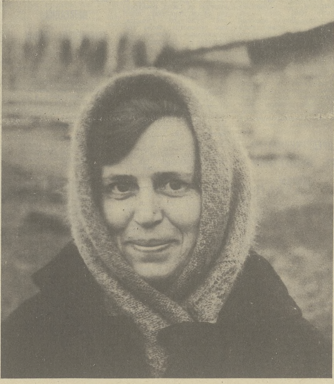
Верхнекетский район.