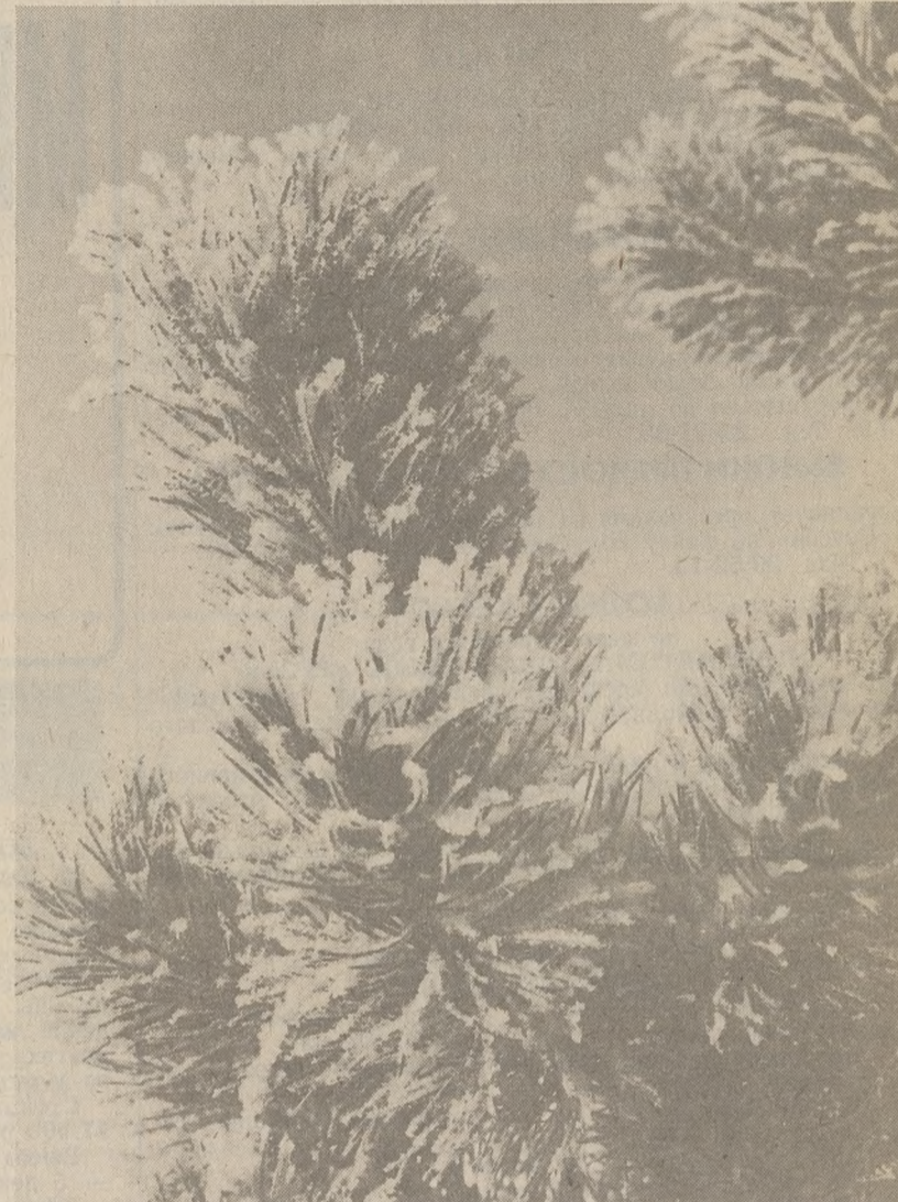
Красиво, правда?