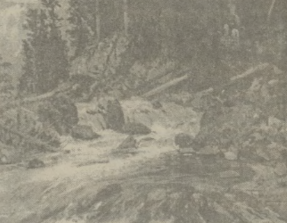
На снимках: «Горная речка», «Маши»