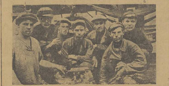
Ударная комсомольская бригада вагоном цеха новосибирских линейных мастеровских.

С 1 мая увеличилось пассажирское движение. Увеличилось потребление в ремонте пассажирских вагонов.