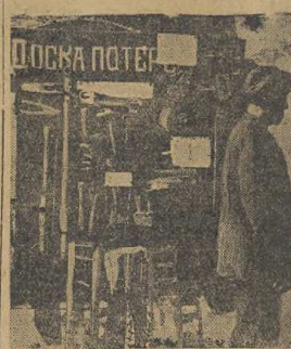
Рабочие томской лесовой фабрики «Машинострой» организовано выступили на борьбу с потерями. На снимке: Доска потерь с экспонатами, организованная по инициативе рабочих.