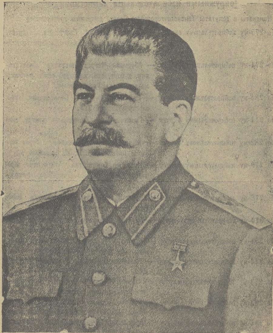
Иосиф Виссарионович СТАЛИН.