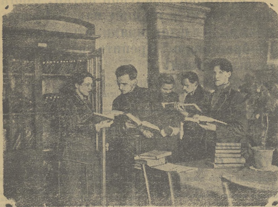
Чисто и уютно в кабинете истории СССР. В образцовом порядке находятся книги. В кабинете много стенов, иллюстрирующих славную историю нашей Родины. Здесь студенты и научные работники в любое время могут получить нужную книгу. Вот почему в