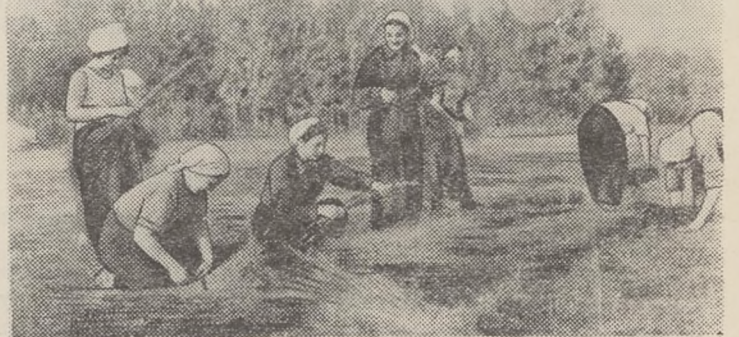
На снимке: студенты II курса химического факультета на уборке льна в колхозе «Авангард», Асиновского района.