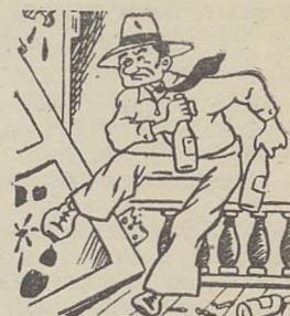
Рис. Вл. МОИСЕЕВА, текст О. КОРОЛЯ.