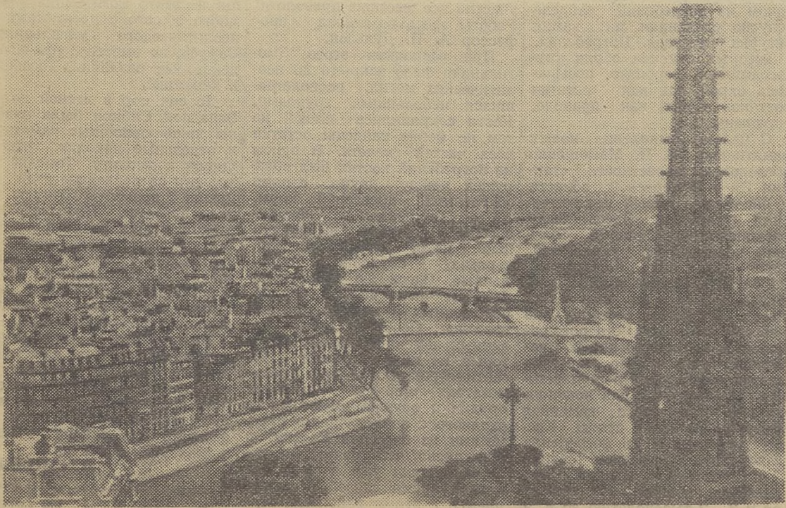
На снимках: (сверху вниз) 1. Сена. 2. Панорама Парижа.