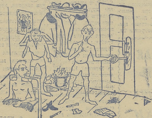
Когда идет санкомиссия.