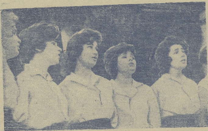
Поют девушки с ИФФ.