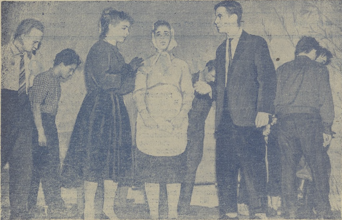
Заключительная сцена спектакля «Внук короля» (драматический кружок ТГУ).