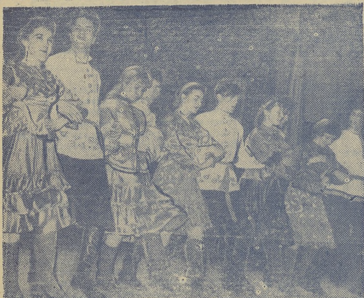
Пляска «Травушка-муравушка» (хореографическая группа университета).