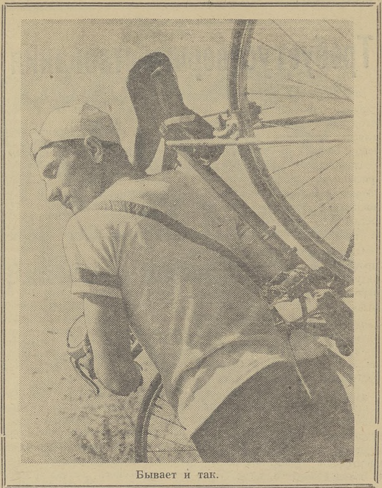
Бывает и так.