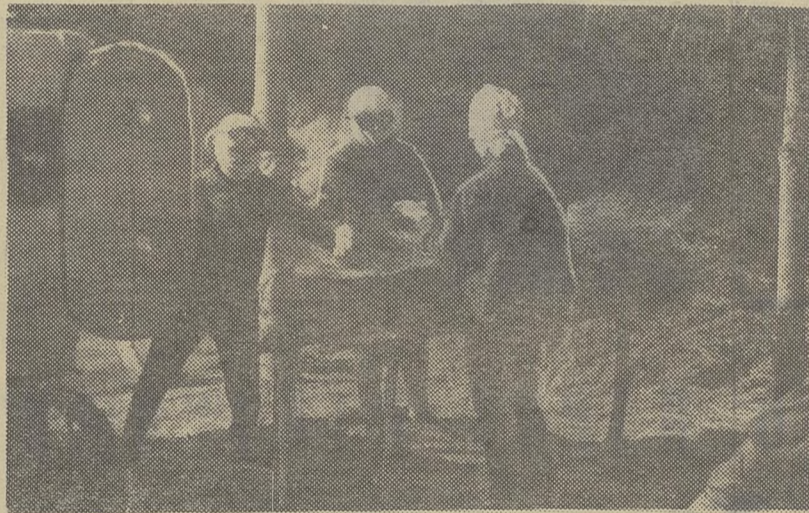
На обмолоте льна работают второкурсники биолого-почвенного факультета (колхоз им. Ленина, Асиновское производственное управление).