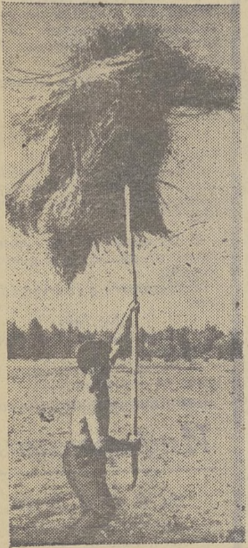
Это не цирковой трюк. Это называется «скирдование льна».

Я приехал в Больше-Дорохово в 6 ч. В других бригадах