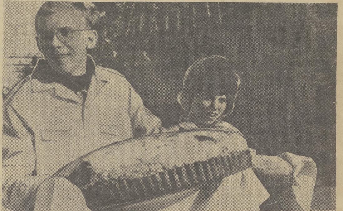
Каравай сейчас трудно удержать в руках, но через несколько минут его разделят и работавшие на полях, и работавшие в Васюганье.