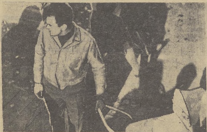
Этот папа награжден медалью «За трудовое отличие». Не беда, что из коляски доносится плач — на трибуне интересней.