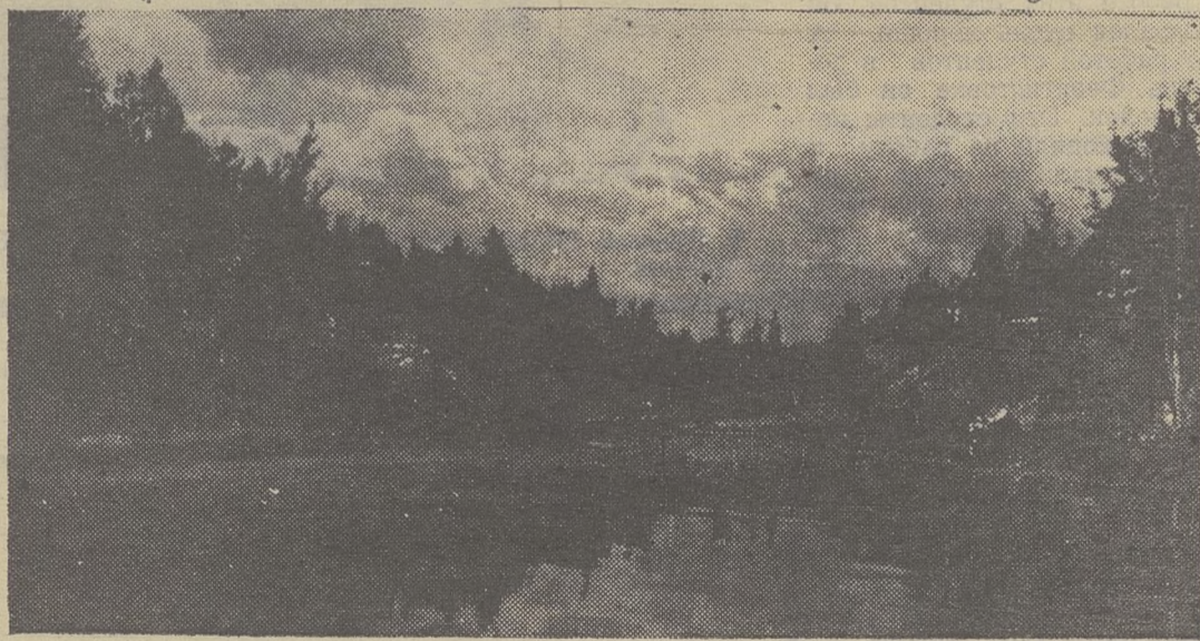
Это живописное местечко находится неподалеку от полей, где работали наши студенты.