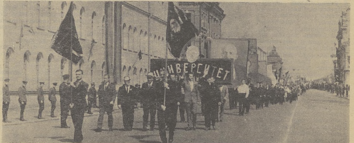
ПЕРВОМАЙСКАЯ КОЛОННА УНИВЕРСИТЕТА НА ПЛОЩАДИ РЕВОЛЮЦИИ.