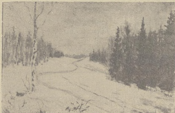
«ЗИМНИЙ ДЕНЬ». 1961 г.

Это признано всеми — выставка произведений