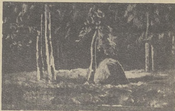
«БЕРЕЗКИ». 1966 г.

Это признано всеми — выставка произведений