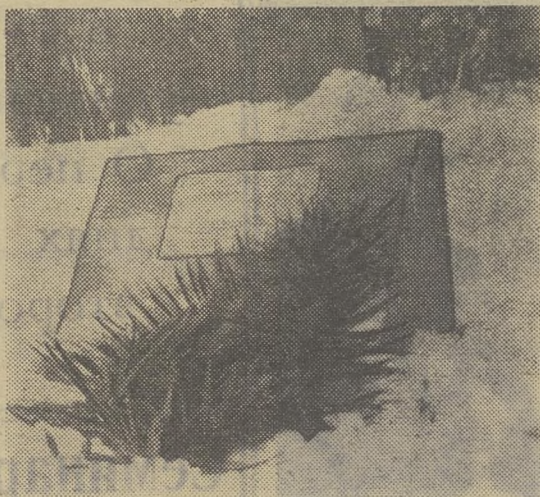
Здесь будет памятник В. В. Куйбышеву.