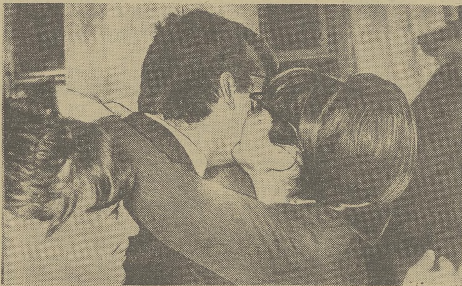
Режиссера с премьерой!