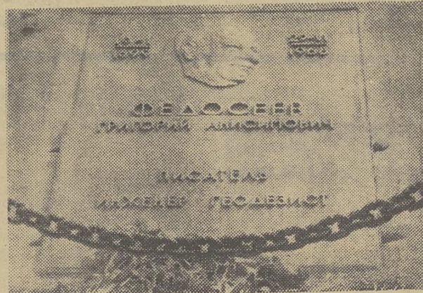
Памятник Федосееву на Иденском перевале в Восточных Саянах, открытый в июле этого года.

От неудачного гребка выбита передняя рука «Взметнулась вверх рука — прощай, нога!» — почти так в песне поется. Вместо того, чтобы небрежно поправить гребь, ребята трепыхаются между камер. А плот неотвратимо несет в объятия громадной коряги, хищно распутившей свои щупальца. Удар!!! Треск... коряги.