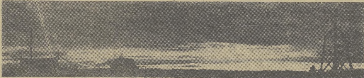
ПРАКТИКА БЫВАЕТ РАЗНАЯ. ВОТ У СТУДЕНТОВ 459 ГРУППЫ МЕХМАТА — АСТРОНОМО-ГЕОДЕЗИЧЕСКАЯ. БЫЛА ОНА ЛЕТОМ, А ПОМНИТСЯ ДО СИХ ПОР, ПОТОМУ ЧТО СЕВЕР — УДИВИТЕЛЕН.