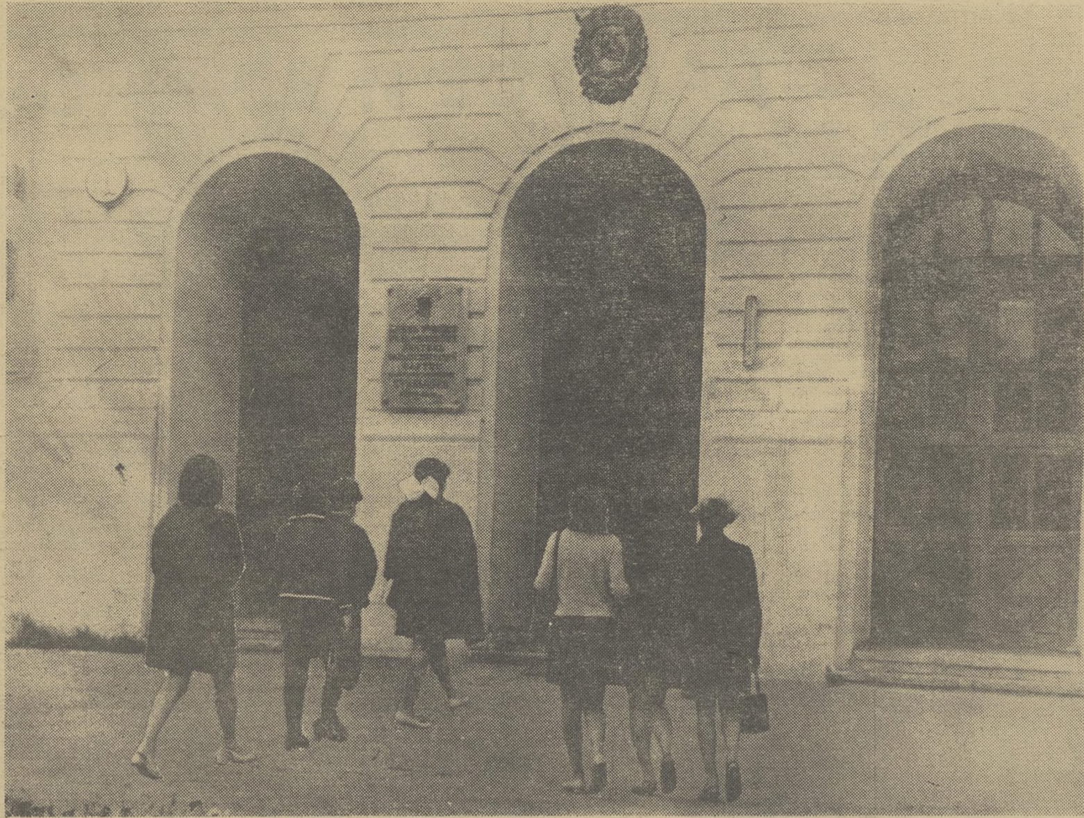
1 сентября.