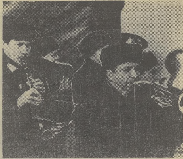
● Какие бы музыкальные инструменты не придумали в будущем, для демонстраций, верно, навсегда останется духовой оркестр с глухим, будто изнутри, от сердца идущим ударом барабана и сильной нежностью труб.