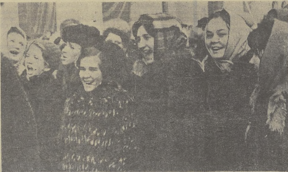
Фотографии демонстрации 7 ноября сделал А. Васянович

Комитет комсомола организовал комиссии для проверки того, как прошел 1 этап Ленинского зачета на ММФ, ЭФ, РФФ. Комиссии приступили к работе.