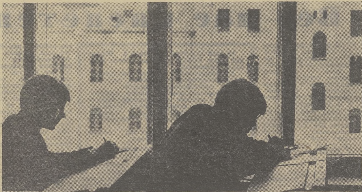
В студенческие аудитории приглашена сессия. На снимке: студенты РФФ готовятся к сдаче зачета.

Не является ли низкий уровень организационной работы и успеваемости на ФПМ (секретарь Володя Ильин) результатом слабой учебы активистов этого факультета (абсолютная успеваемость этого актива —