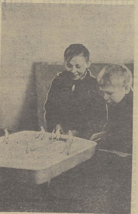
1 июня — Международный день защиты детей.

Теме счастливого детства посвятил свои снимки наш фотокор В. Афанасьев.