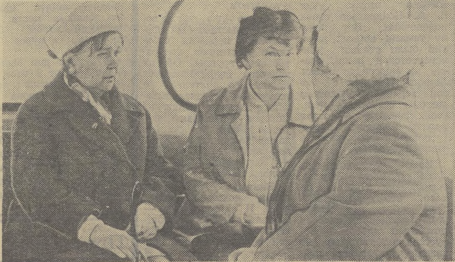
Еще раз проехать по улицам города своей юности...