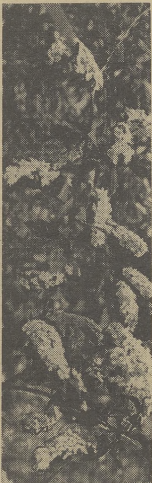
ЦВЕТЕТ ЧЕРЕМУХА В САДУ, ЦВЕТЕТ ЦВЕТАМИ БЕЛЫМИ.

В предыдущем номере в материале «Королева» называет победителей была допущена ошибка. С результатом 58,5 сек. третье место заняли девушки экономического факультета.