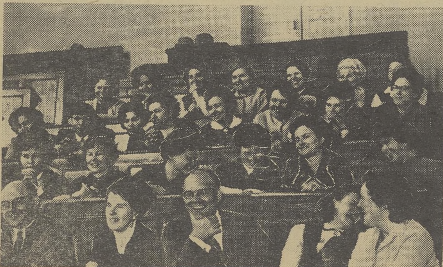
Собрались в 144 аудитории, где слушали лекции по химии.