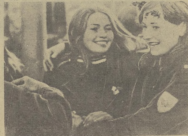
Уезжали — пели... «Вот опять прощание с городом, расстаемся не до седины... И вот встреча! С Томском с друзьями!...».

Сегодня мы рассказываем об отряде «Универсал».