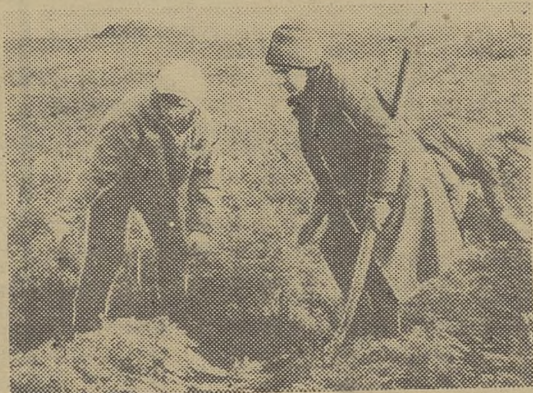
НА СНИМКАХ: фронт уборки моркови в совхозе «Степановский».