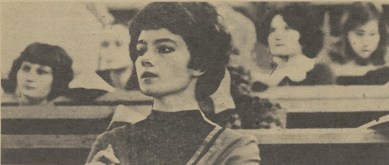
В университетскую программу обучения включены многие спецкурсы, разработанные ведущими учеными нашего вуза.