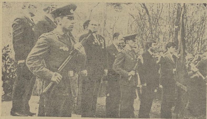
НА СНИМКАХ: 9 мая 1974 г., возложено венков к памятнику погибшим, на полях сражений во

На 2-й странице «ЗСН» читайте статью маршала Советской Армии К. П. Казакова