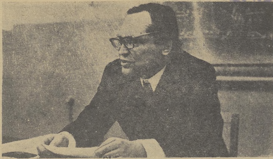
НА СНИМКЕ: с лекцией выступает Н. С. Черкасов.