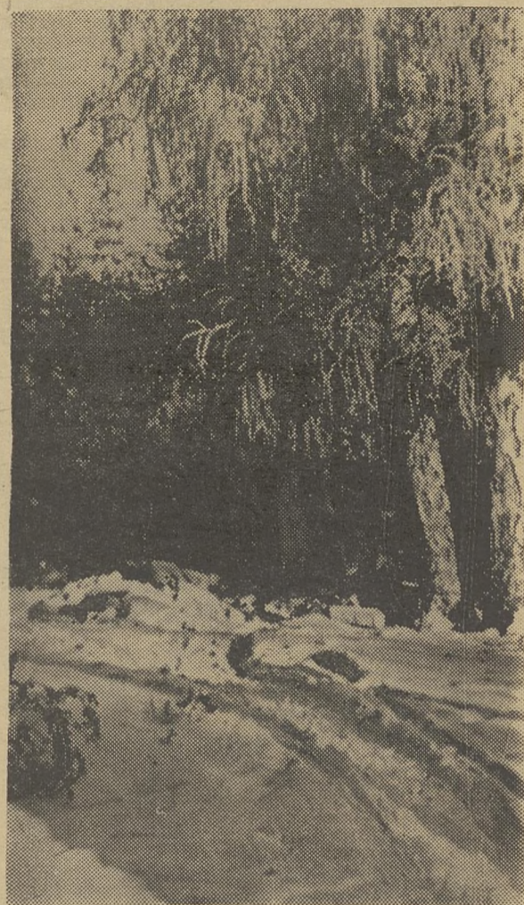
ЯНВАРЬ. УНИВЕРСИТЕТСКАЯ РОЩА.

Разве это невыполнимо? И. ГОССЕН, председатель художественного совета ТГУ.