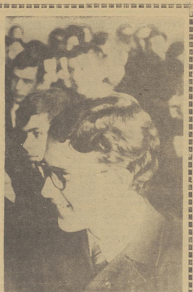
НА СНИМКЕ: в зале конференции.

Репортаж с седьмой традиционной ежегодной военно-патриотической конференции читайте на 2-й странице.