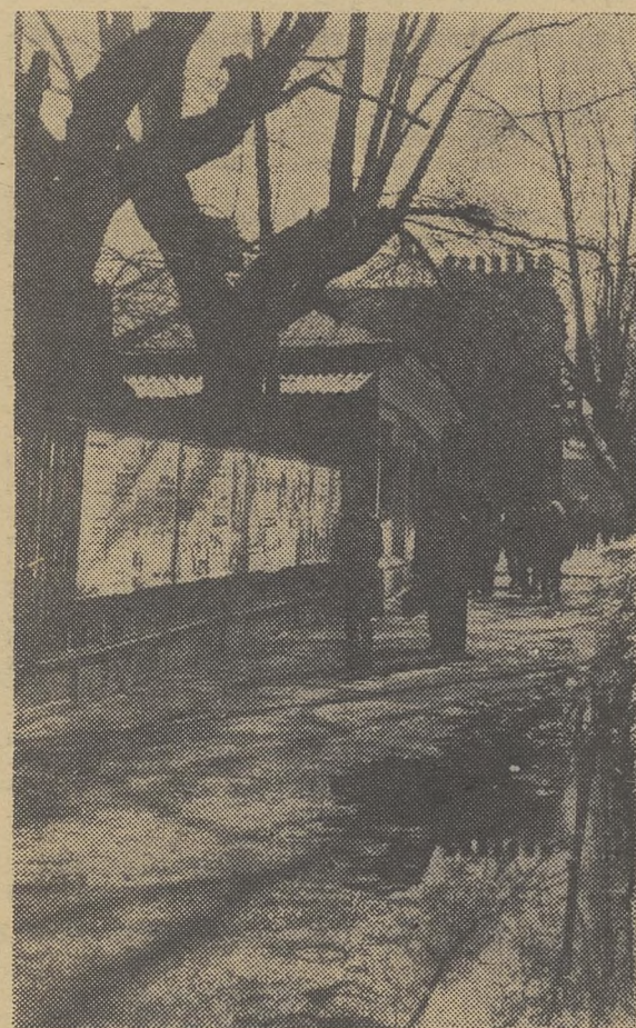
Весна идет по городу.