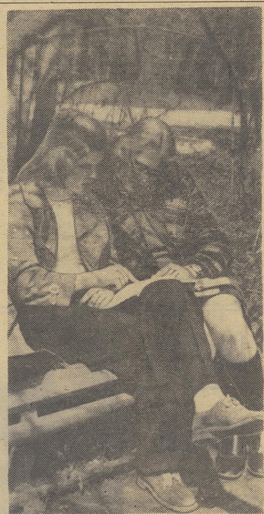
СЕССИЯ ЕСТЬ СЕССИЯ...