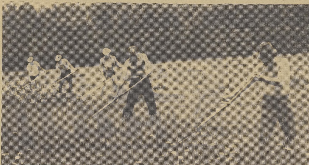
НА СНИМКЕ: сотрудники НИИ ПММ на сенокосе.