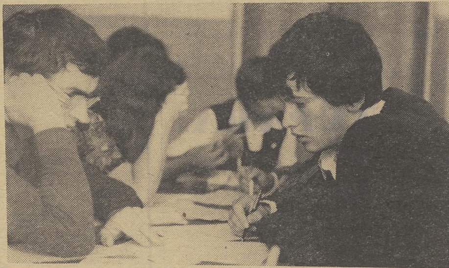
НА ЭКЗАМЕНЕ ПО МАТЕМАТИКЕ.

Будем надеяться, что все они, наши младшие, с честью оправдают звание студента Томского университета.