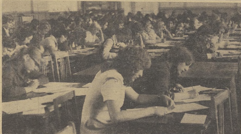
СОЧИНЕНИЕ ПО ЛИТЕРАТУРЕ.