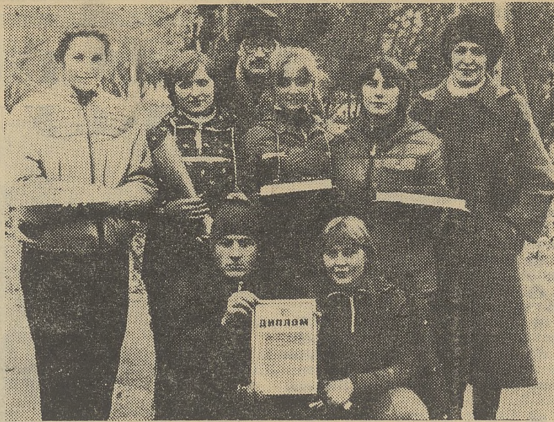
НА СНИМКЕ: команда-победительница эстафеты.

Помимо традиционных призов лидировавшая команда награждена подпиской на газету «За советскую науку».