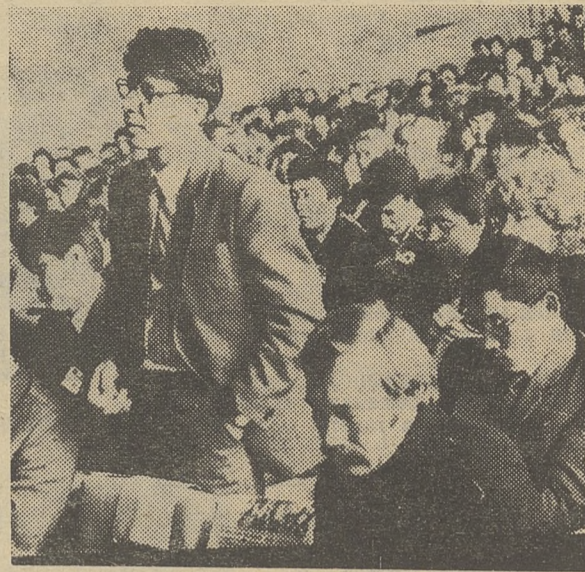
Вопрос из зала.

● Комсомольская организация молодых научных сотрудников университета успешно шефствует над семьей ПТУ города и области.