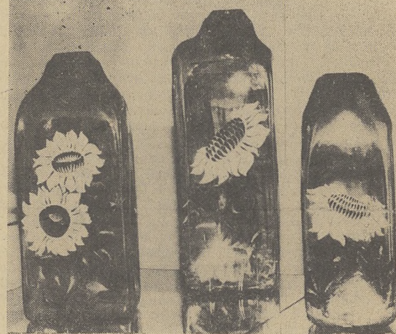
НА ВЫСТАВКЕ ПРИКЛАДНОГО ИСКУССТВА.

Н. ШАРИНСКАЯ, вед. специалист отдела библиографии.