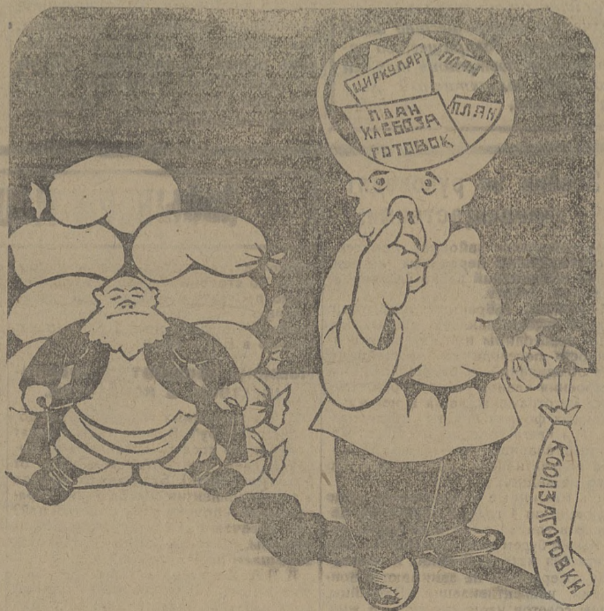
КУЛАК: У меня хлеба нет. ХЛЕБОЗАГОТОВИТЕЛЬ: Говорят, что план надо выполнять, а как его выполняешь, если хлеба нет. Этому кооператору, прикрывающему кулака от 107 статьи У. К. не миновать И. Т. Д.

405 пудов конфискованного хлеба раздается бедноте для обсеменения полей.