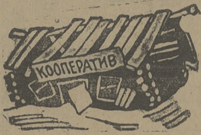
Где плохо работает сельсовет, там плох и кооператив.

Сейчас к работе в секциях привлекаются все активисты села. В культурно-просветительную секцию записалось уже 20 человек.