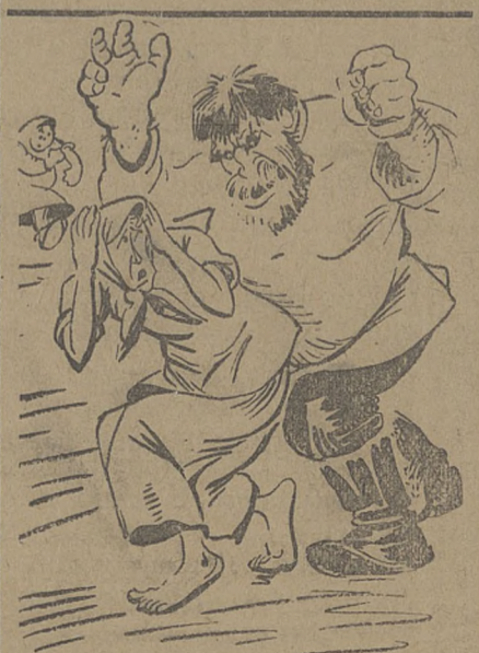
— Из кооператива пришла, а спичек не принесла? — Да они только водкой торгуют...