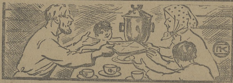
— Получай, баба, выигрыш. Подписался на заем, выиграл тысячу рублей...

Еще хуже с оформлением подписки. От 12 РИК'ов на сегодняшний день нет сведений о взносах по займу. Как там дело обстоит—совершенно неизвестно. Подписку собрали, облигации раздали, а о погашении задолженности молчат. Такое молчание преступно.