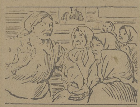
К десятилетию существования женотделов проверим работу женщин в группах бедноты.

На эти деньги школа хочет купить корову. М. ОРЛОВ.