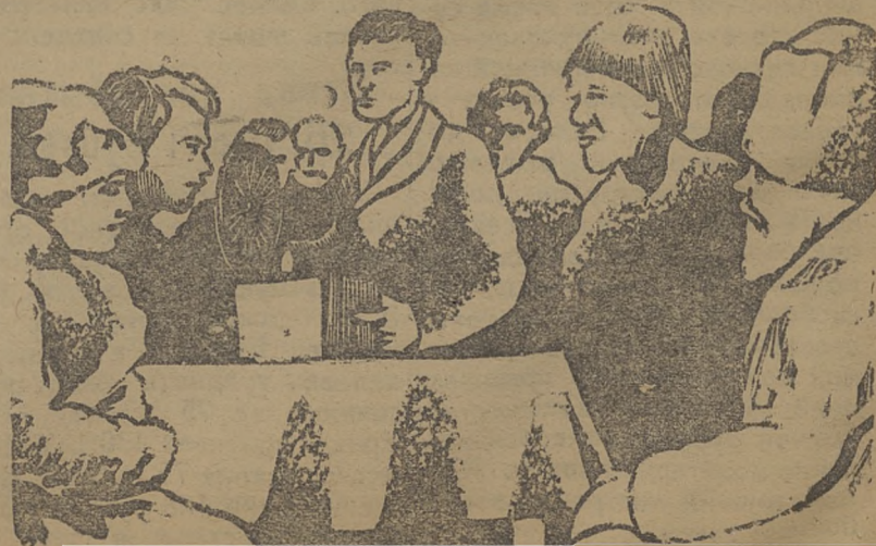
Слушает по радио доклад о кооперировании и бойкоте кулаков.