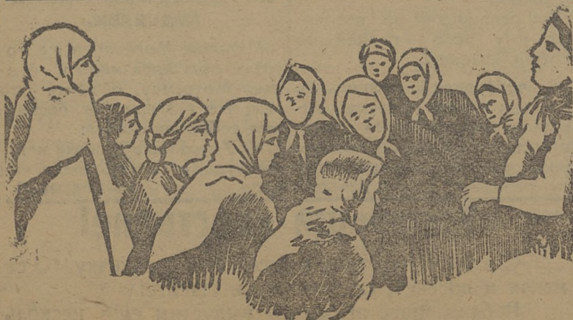
На делегатском собрании обсуждают вопрос об усилении сбора классового пая.

Большинство кооператоров низовки потреббществ за ядут, когда их подтолкнут. С.