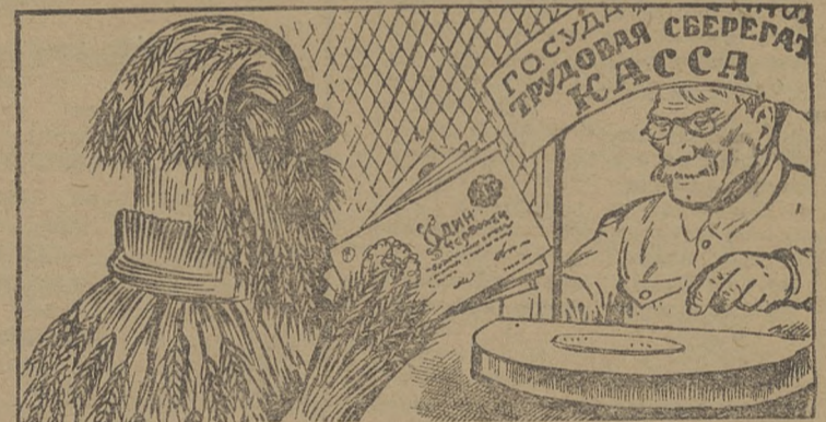
Внося излишние средства в сберкассу, крестьянин поможет делу поднятия урожайности и улучшения сельского хозяйства.