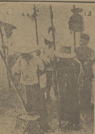
Китайский революционный отряд

Отдельные отряды революционных войск насчитывают до 6000 бойцов.