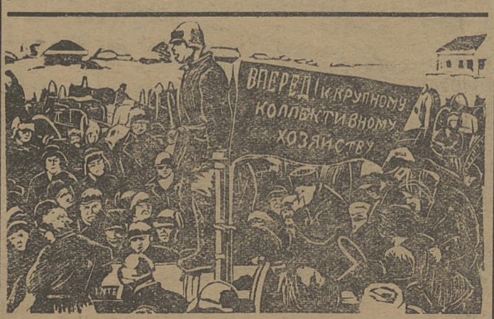
Митинг в селе, проведенный коммуной „Карл Маркс“. На митинге присутствовало несколько сот человек.

Укрупнение совхоза предполагается произвести за счет территории, принадлежащей казачьему населению, где имеется 22 тысячи гектаров неиспользуемых земель, и свыше 80 тысяч гектаров будут взяты из числа излишков земли у земельных обществ.