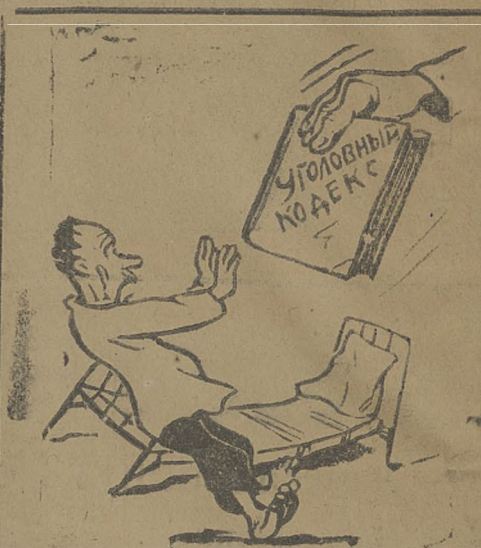
К уголовной ответственности — за бездельность и срыв кооперативных планов!