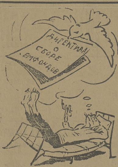
Сельсоветчики видят такие сны. Только статьями Уголовного Кодекса можно разбить их.

Сплошная коллективизация наносит окончательный удар кулачеству, попом и спекулянтам. Вся эта работа поднимает сейчас вой, ведет бешеную агитацию против колхозов. Под влиянием кулацкой агитации разбазаривают в деревнях имущество, уличаются с от-