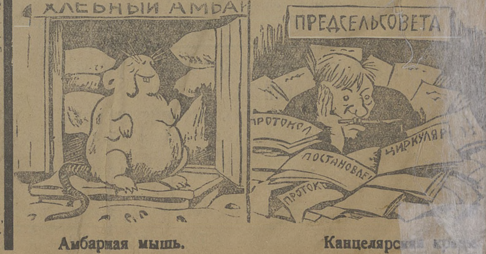
Амбарная мышь. Канцелярская крыса.