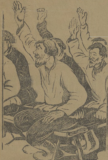
Готовым к коллективному вступлению всех пайщиков — батраков, бедняков, середняков — в коммуну.