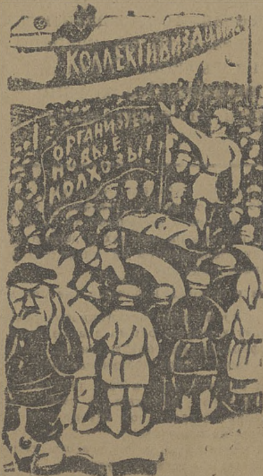
Коопактивисты! Покажите пример! Первыми вступайте в колхозы, организуйте новые коммуны!

Здесь нужны срочные оздоровительные меры. С. Б.