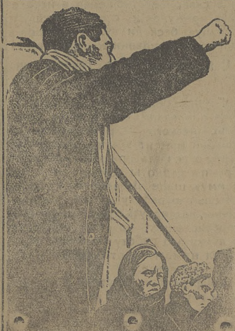
Ленинградские пролетарии на станции Большая-Речка.

Сретенский—особенно плохо в колхозах, которые должны иметь в сефондах 26281 цент. а на 10 февраля имеют только 7383 цент. По земельным обществам задание выполнено на 70 с лишним процент.