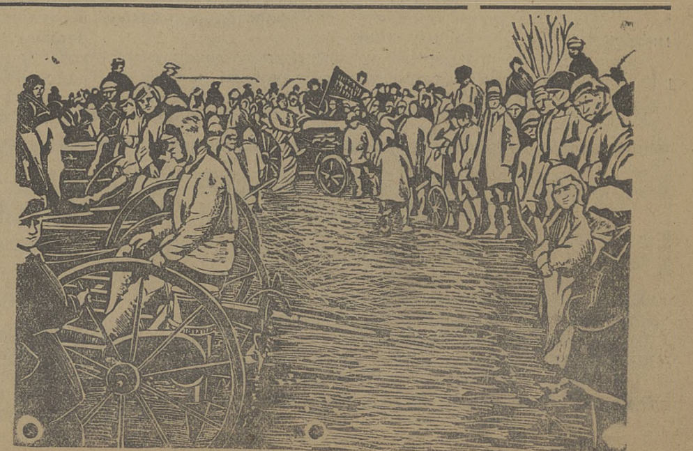
Пробный выезд в с. Катунском.