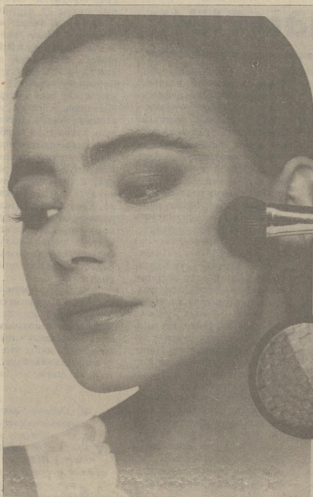
Выигрышное сочетание: сухие румяна двух тонов