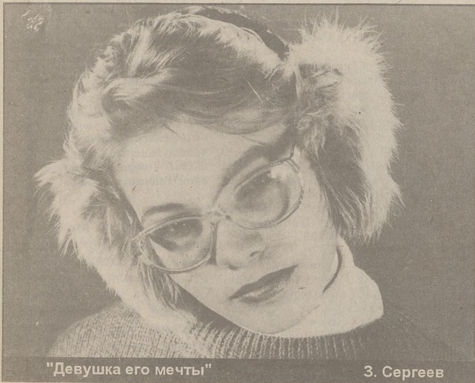
"Девушка его мечты"

Адрес Дома детского творчества: Томск, ул. Кривая, 33; проезд авт. 1, 8, 9, 18, 22, 40, трол. 1, 3, 7 до ост. "Строительный институт".