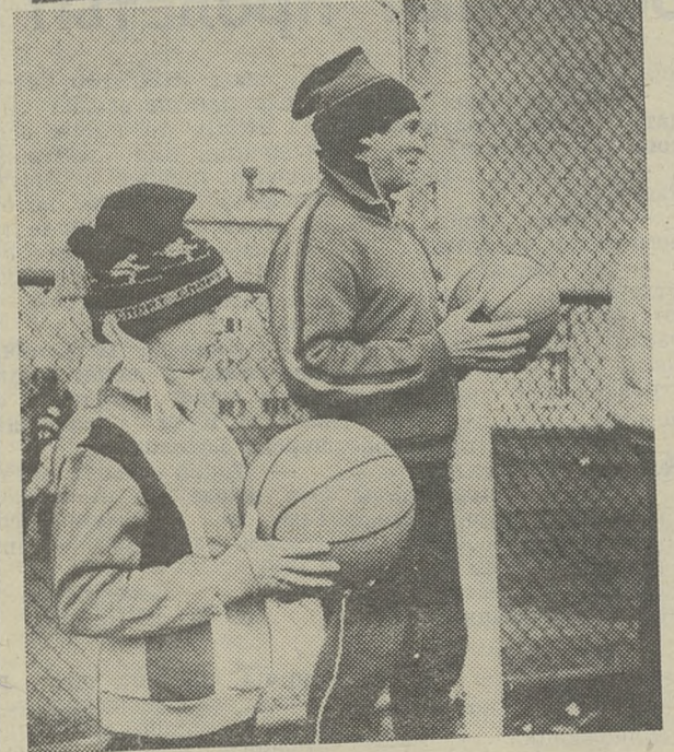
Пусть он был не очень солнечным и даже холодным, этот второй день мая, но традиционная спартакиада строителей состоялась. Эти снимки наш фотокорреспондент сделал в тот день. В новом шахматном зале встретились шахматисты, а в спортзале азартно, с высокой спортивной страстью играли волейболисты. Ну, а дети? Да, и они пришли в стартовый городок, и тоже приняли участие вместе с папами и мамами в спортивных играх, провели свои старты.