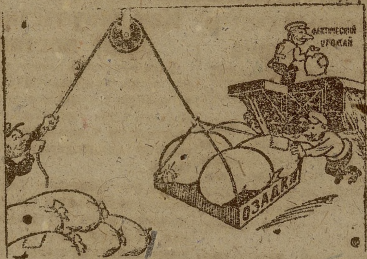
С целью скрыть фактический уржай и сделать возможным последующее его расхищение, владельцы оставляют зерно в соломе, в озарках (схвостье) ДЕМЕНЮК: Колл. Гони—в „черный амбар“... Все равно пропадут